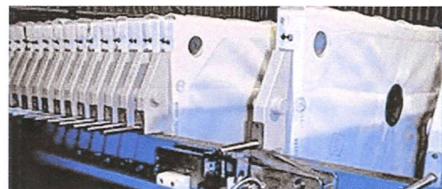
Filterpresse mit Durchsteckfiltertüchern